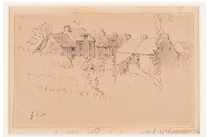
Jean-François Millet. Hameau à Gréville. 1871. Crayon graphite, plume et lavis d'encre sur papier, Cherbourg-en-Cotentin.

1 L'exposition Voyages en terre inconnue. Boudin, Renoir, Signac... en Cotentin au musée Thomas Henry à Cherbourg te fait découvrir la région du Cotentin où les impressionnistes ont posé leurs chevalets pour peindre ses paysages.